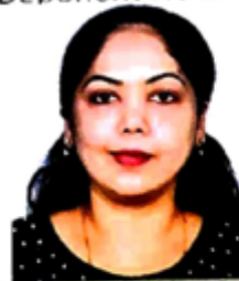
Deponent No. 2