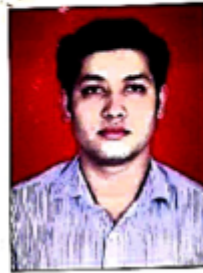
Deponent No 1